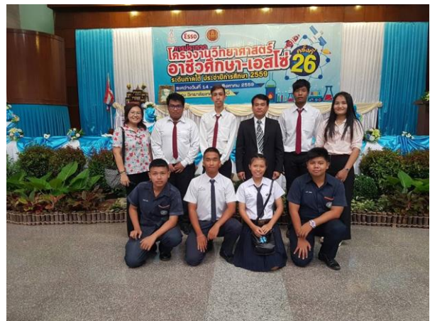
รูป : นักเรียน และครูที่ปรึกษา เข้าร่วมประกวดโครงงานและแข่งขันตอบปัญหาวิทยาศาสตร์