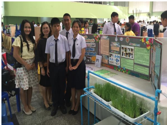
รูป : คูหาแสดงผลงานโครงงานวิทยาศาสตร์ วิทยาลัยเทคนิคภูเก็ต ระดับ ปวช.