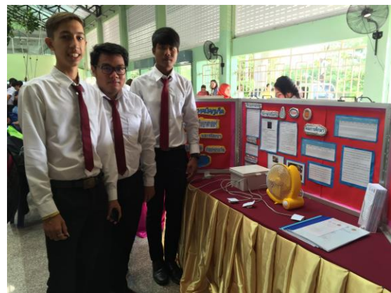
รูป : คูหาแสดงผลงานโครงงานวิทยาศาสตร์ วิทยาลัยเทคนิคภูเก็ต ระดับ ปวส.