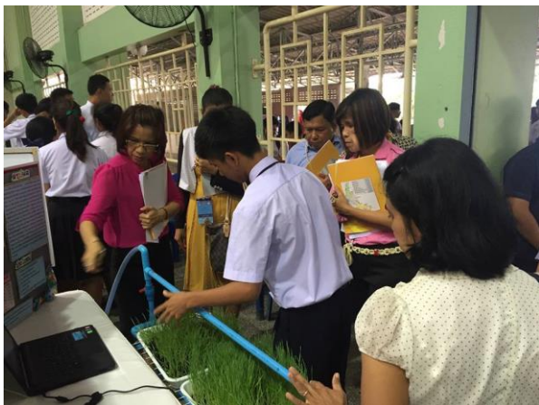
รูป : คณะกรรมการเยี่ยมชมฟังการบรรยาย ดูการสาธิต ชักถาม และให้คำแนะนำที่คูหาแสดงผลงาน โครงงานวิทยาศาสตร์ วิทยาลัยเทคนิคภูเก็ต