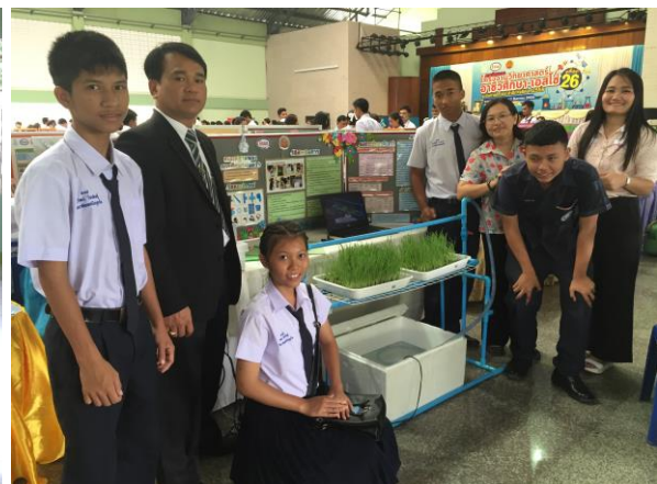
รูป : ผู้อำนวยการวิทยาลัยเทคนิคภูเก็ต มาให้กำลังใจแก่นักเรียน นักศึกษาในการประกวดโครงงานฯ