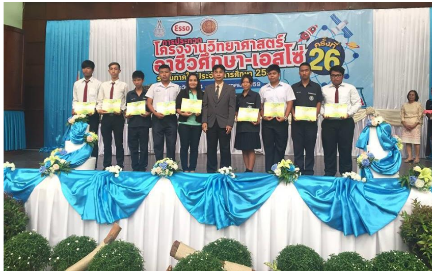
รูป : นักเรียน และครูที่ปรึกษาชั้นรับเกียรติบัตรกับผู้อำนวยการศูนย์ส่งเสริมและพัฒนาอาชีวศึกษาภาคใต้